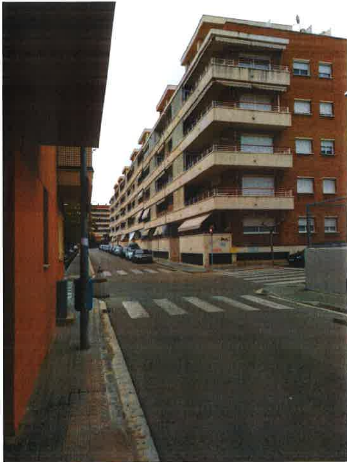
Un altre fanal enmig de la vorera, aquesta vegada al carrer Ramon i Cajal