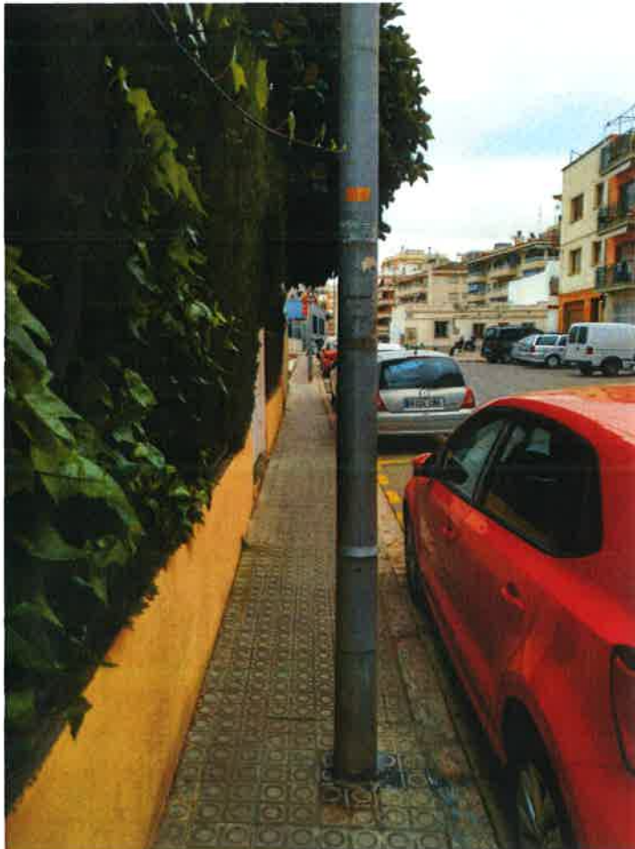
Exemple de fanals al mig de la vorera al Carrer Castellet.