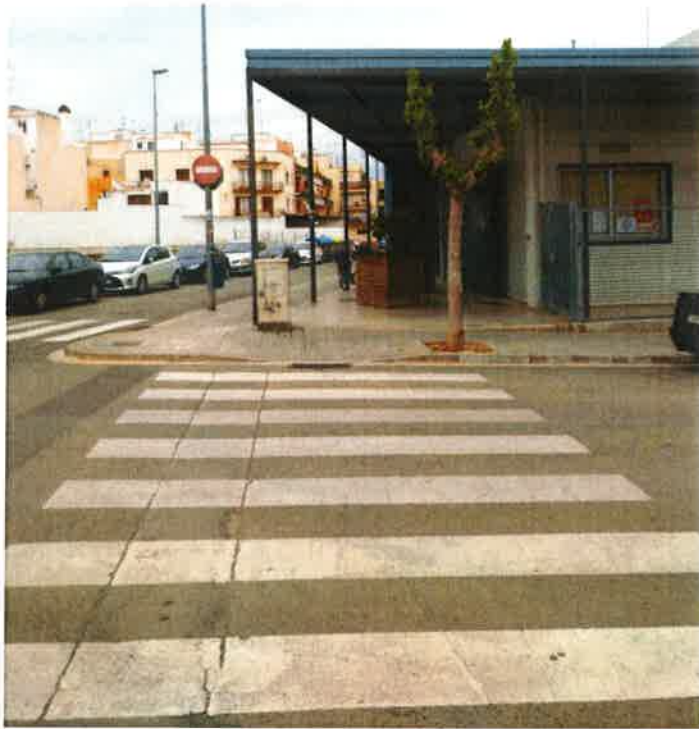
Vista de l'accés d'infantil, on demanem una barana de seguretat