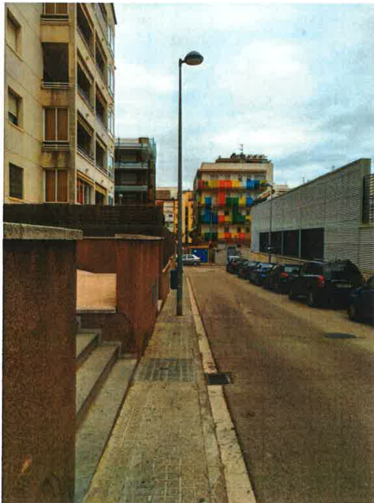
Al mateix carrer, a l'altre costat de la vorera, observem el mateix problema del carrer castellet, voreres estretes i amb fanals per al mig que impedeixen el pas