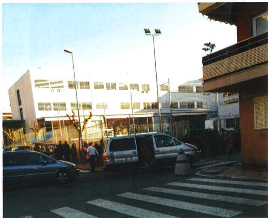
L'accés de Primària pel carrer Ramon i Cajal. Cotxes en el pas de zebra, gent al mig del carrer ...