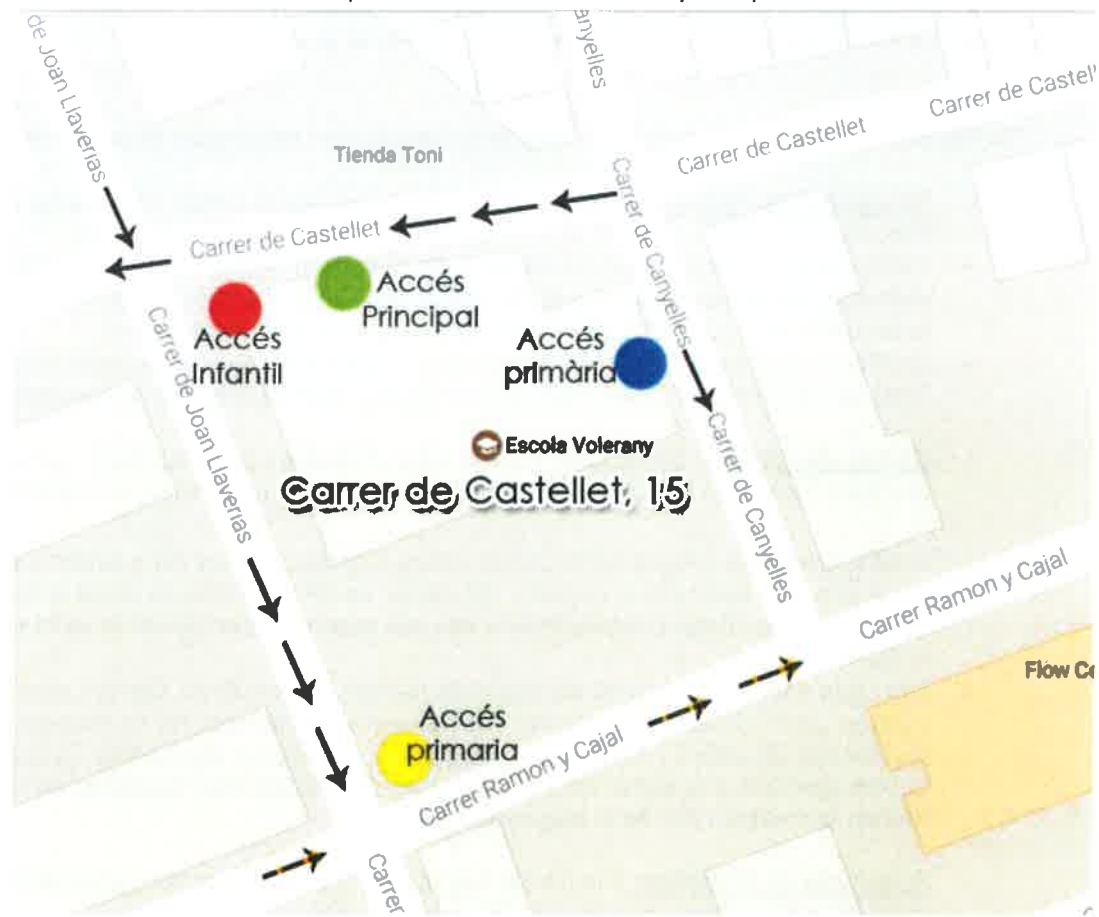
Mapa d'ubicació i accessos principals