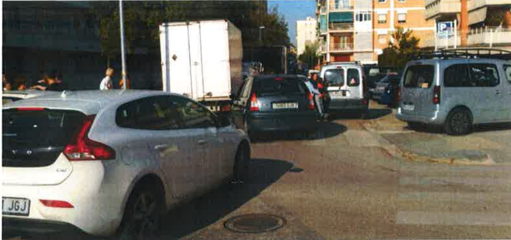
Al mateix carrer Castellet, tenim als cotxes aparcats en doble fila, provocant un embús cada matí