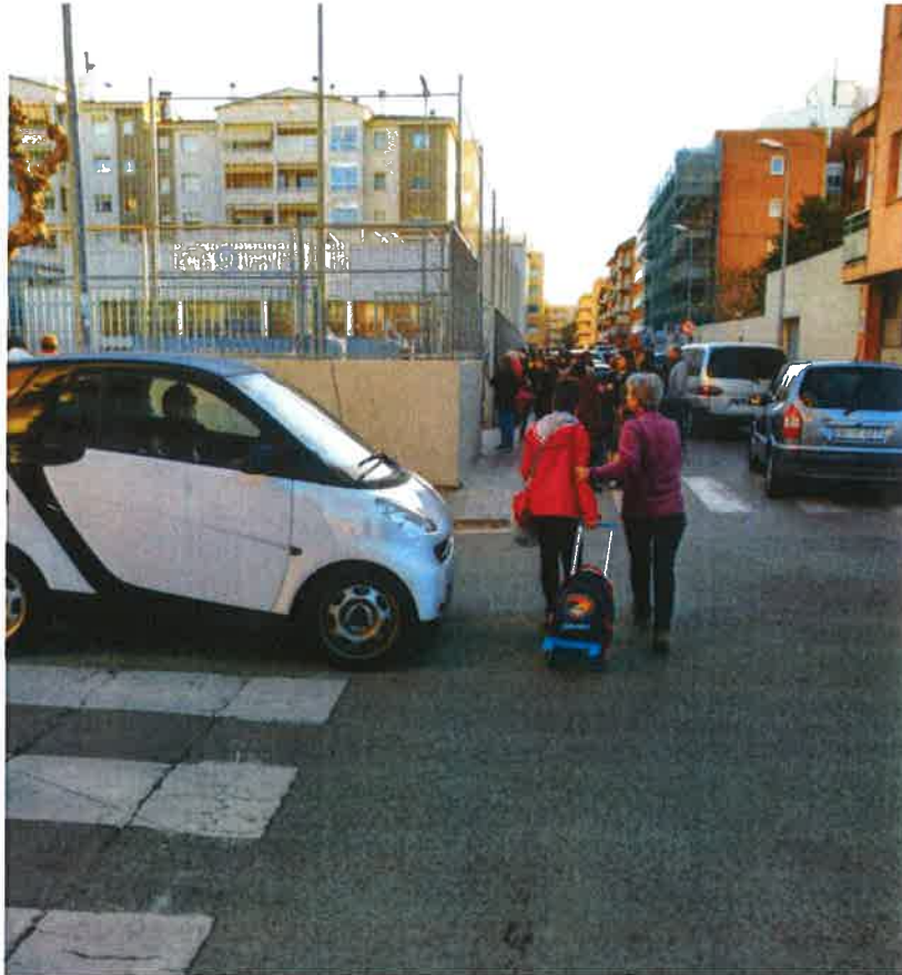
Cotxes que no paren en els passos de zebra, evidenciant la falta d'un agent de mobilitat