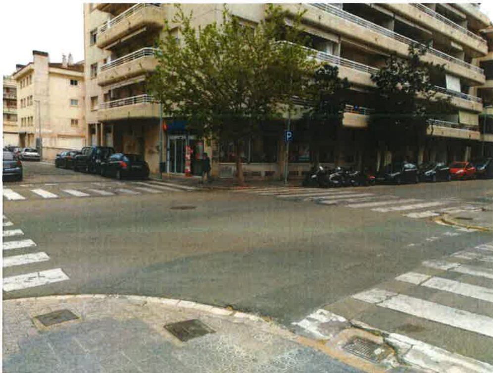
La cruïlla de Francesc Macià amb Joan Llaverias. Un dels més conflictius en el camí escolar, necessita una bona senyalització, indicant que és un pas escolar, i també semàfors.