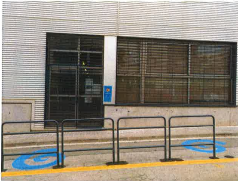
Accés dels nivells superiors de Primària, està senyalitzat i compta amb barana de protecció.